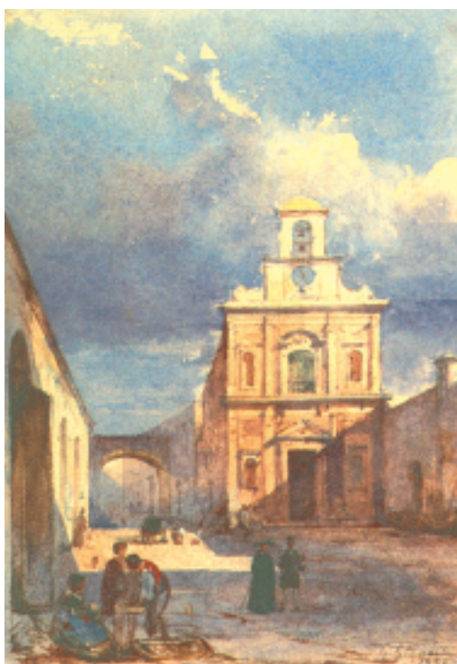
G. Gigante - La chiesa dell'Annunziata a Gaeta, 1832

Ordine dei Medici Chirurghi e degli Odontoiatri della Provincia di Latina