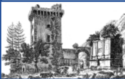
Torre dell'Epitaffio - Luigi Rossini, 1839

L'Ordine dei Medici di Latina intende realizzare la raccolta in volume di una serie di saggi e documenti concernenti la storia della sanità nella provincia di Latina dall'antichità all'età contemporanea. L'idea nasce nell'ambito di un progetto più vasto e ambizioso: dare voce ad una memoria collettiva e ad una tradizione che ricongiunga il presente al passato e rinsaldi il senso di appartenenza alla comunità di fronte alle difficili sfide poste dalla società contemporanea. Si tratta dunque di far sì che una storia della sanità del nostro territorio - spesso inesplorata o dimenticata - parta dalle esigenze del presente per farsi presente: per essere cioè anzitutto conosciuta, ma anche per poter divenire strumento di comprensione di una realtà locale soggetta a profonde trasformazioni e solo in tempi recenti stimolata a ricercare le sue radici e le sue vocazioni. L'aspirazione è quindi di iniziare a costruire un percorso teso a valorizzare e sistematizzare un ricco patrimonio storico e culturale troppo spesso guardato con disattenzione