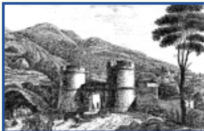
La Portella - Luigi Rossini, 1839

A pochi chilometri dalla torre dell'Epitaffio, sorvegliata dalle guardie napoletane di polizia e di dogana, che effettuavano minuziose perquisizioni sui viaggiatori, la Portella segnava l'inizio del Regno di Napoli. Si tratta di un edificio, risalente al XVI secolo, composto da due belle torri cilindriche in mattoni e travertino collegate da un portico in cui si apre una porta a due battenti.