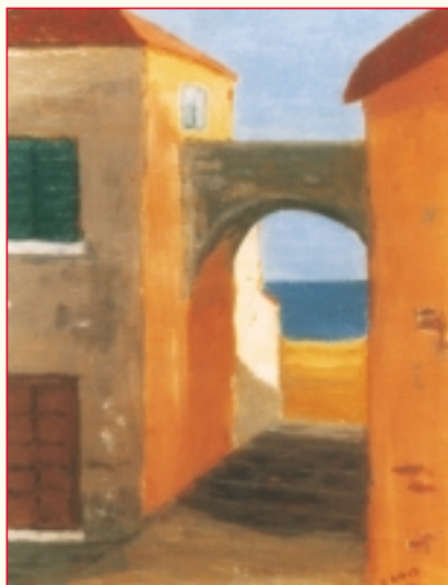
"Calata a mare"

Saranno questi i problemi della professione che l'Ordine e i suoi rappresentanti eletti dovranno affrontare nel prossimo triennio, cercando di mantenere una posizione distinta, ma non distante, nei confronti di altri "poteri" quali quello politico e quello sindacale, in un quadro normativo che vede gli Ordini privi di "potere contrattuale" ma dotati di un "potere etico" che, per essere esercitato, è strettamente legato al decoro e al prestigio conquistati nel tempo, e da un "potere disciplinare" il cui esercizio deve essere potenziato ed attuato a tutela dei Cittadini e della Categoria.