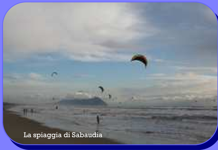
La spiaggia di Sabaudia