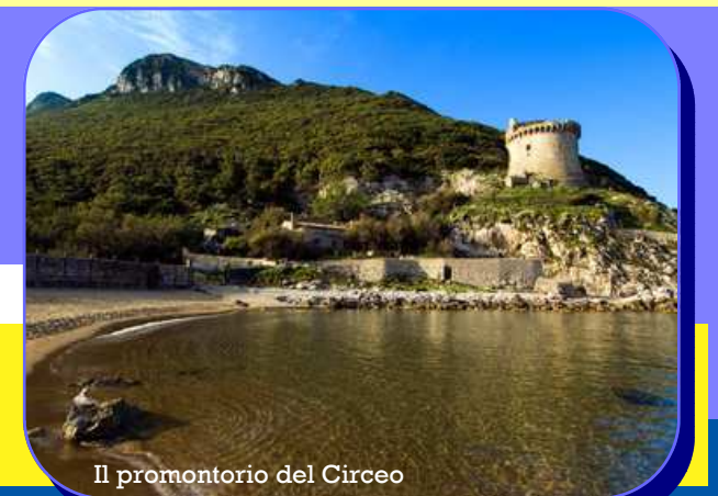
Il promontorio del Circeo